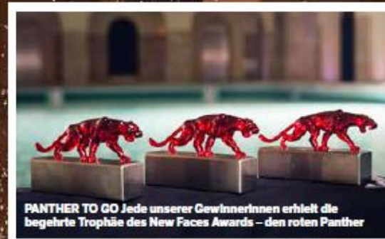
PANTHER TO GO Jede unserer GewinnerInnen erhielt die begehrte Trophäe des New Faces Awards – den roten Panther